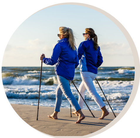
MARCHE IODÉE OU NORDIQUE