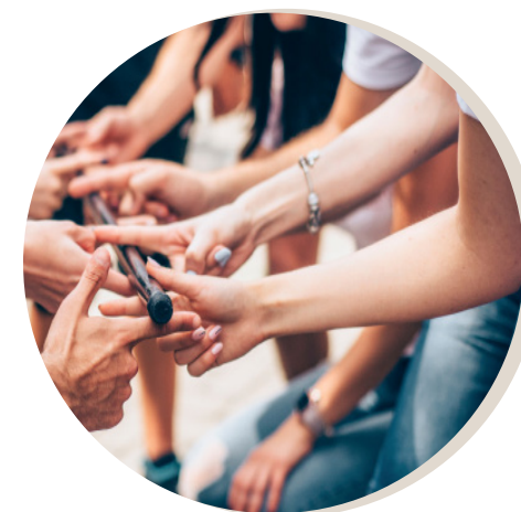
ET BIEN PLUS ENCORE...!

Notre expertise et celle de nos partenaires permettront de construire ENSEMBLE un programme SUR-MESURE qui vous ressemble.