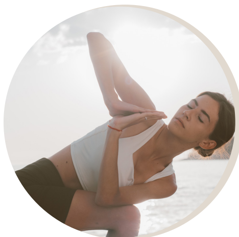
COACHING EN POSTURE