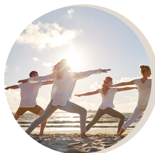
YOGA / PILATES